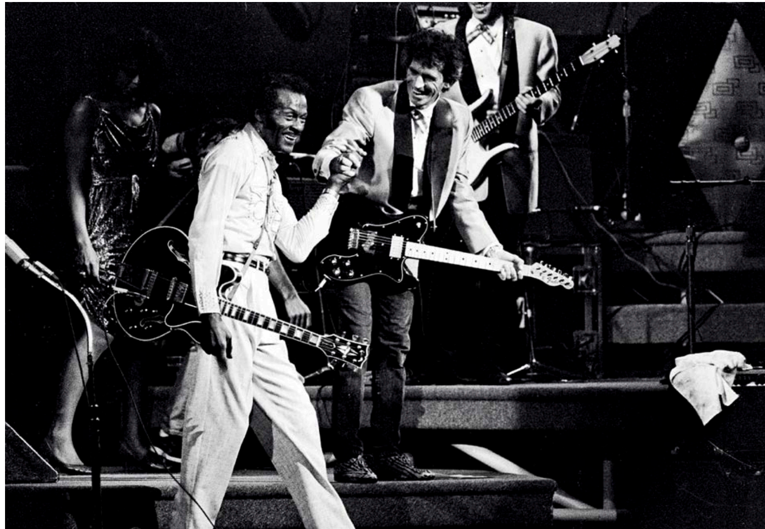
Chuck Berry og Keith Richards storkoste seg på scenen til Fox Theatre i Berrys hjemby St. Louis to dager før 60-årsdagen hans i 1986. Med seg hadde de blant andre Eric Clapton og Linda Ronstadt. Stemningen var ikke alltid like god under øvingene.

å ane noe om neste låt, er Bruce Springsteen. 'Da var han ung og ukjent. Fremdeles er den kvelden på begynnelsen av 1970-tallet noe av det største han har opplevd – og Bruce Springsteen har opplevd mye.