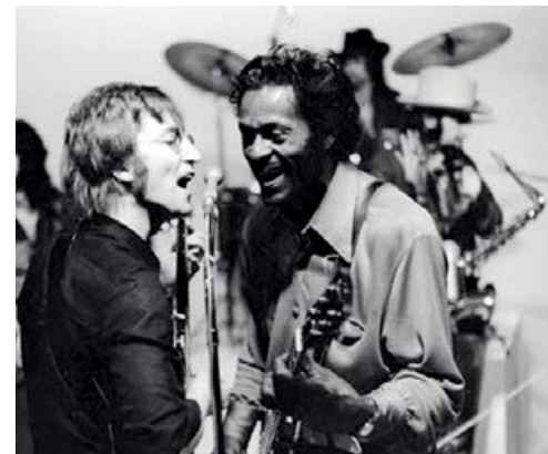
John Lennon og Chuck Berry sammen under et TV-show i 1972. Lennon var nesegrus fan av Berry.

«Jeg fikk rock'n roll-tenning som svært ung da jeg så Chuck Berry. Han er mitt idol.»