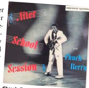
Chuck Berry var frekk nok til å kalle debutalbumet fra 1956 for After School Session. Han var 30.

Afroamerikaneren Chuck Berry siktet seg inn på hvit middelklasseungdom. De som satt godt nok i det til å hate skolen. De som hadde