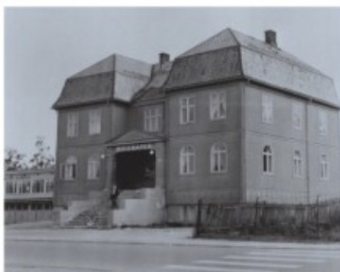
BIOGRAFEN: På folkemunne kalt «Bio'n», var blant annet en kino på Hamar fra 1918 til 1968. Biografen ble revet i 1972. Bildet er tatt i 1964.